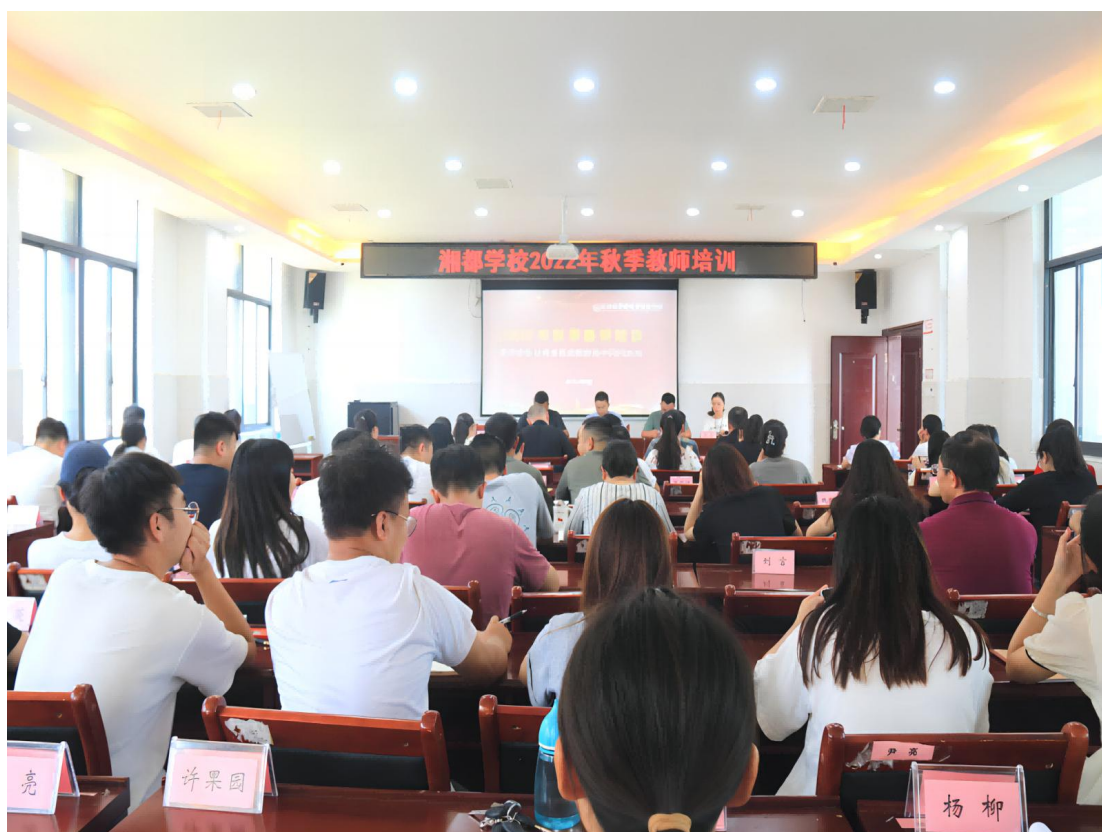
图 1-21 校本教师培训