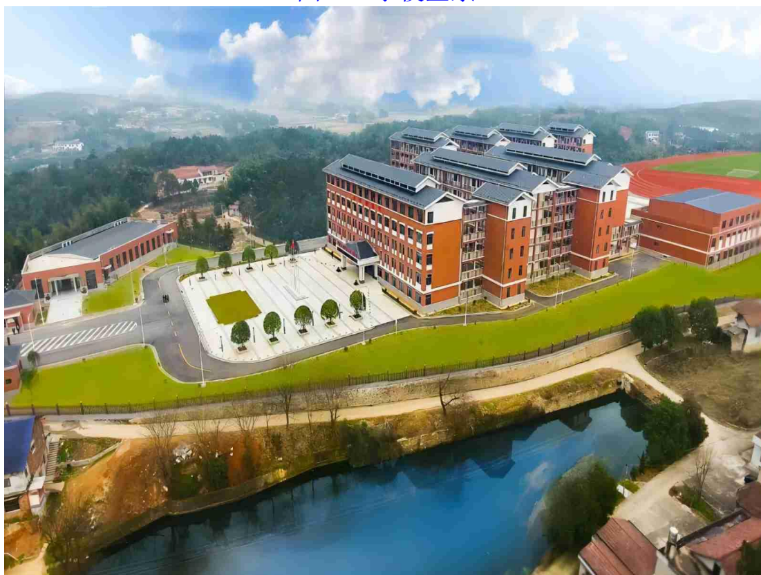
图 1-2 学校全貌