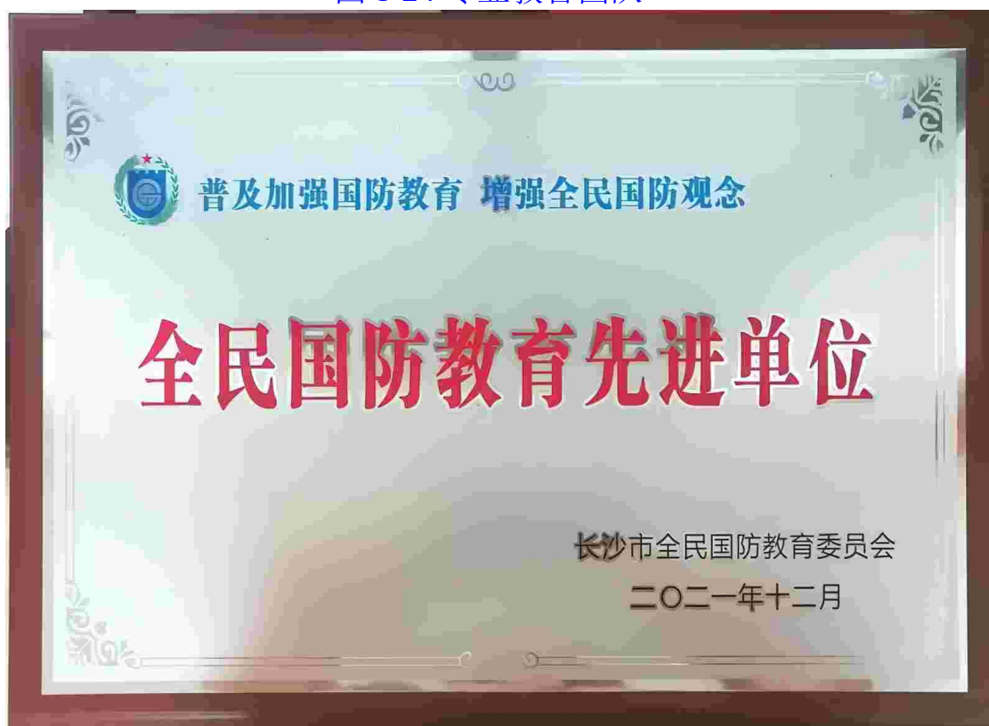
图 1-25 获得长沙市全民国防教育委员会国防教育先进单位