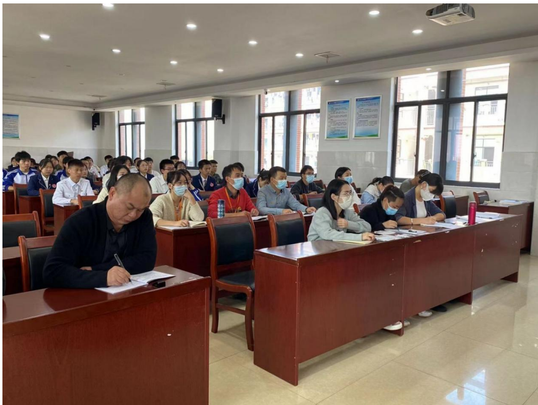
图 1-3 学校全体教师收看党的二十大开幕式，聆听习总书记的报告。