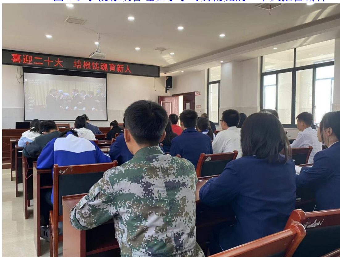
图 1-6 全体共青团员学习党的二十大精神