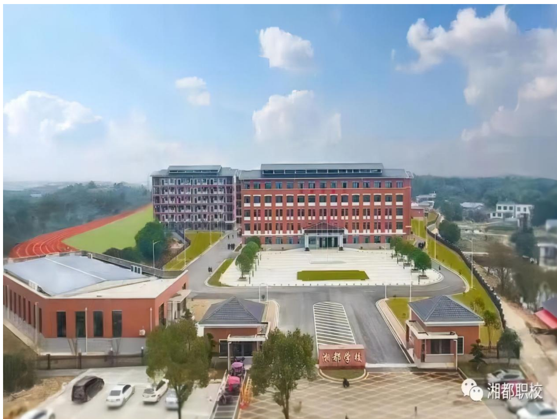
图 1-1 学校全景