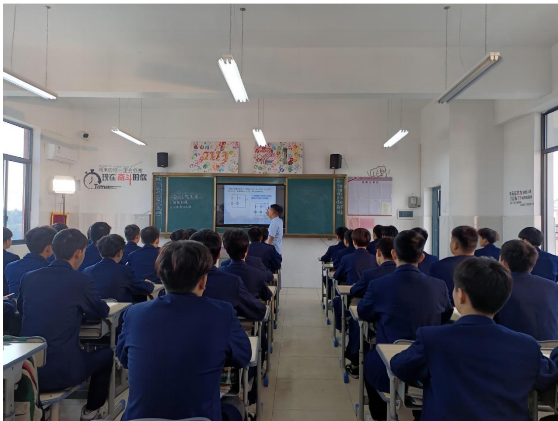
图 1-22 青年教师比武