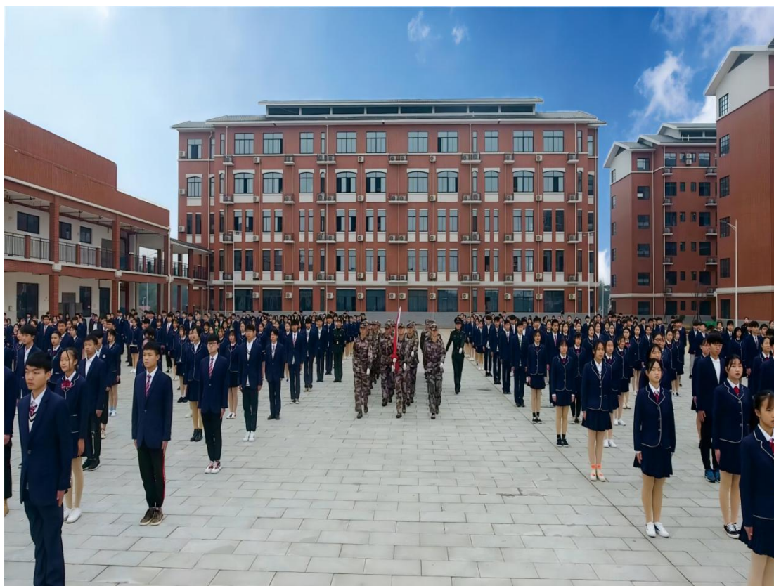
图 1-7 升旗仪式

秉着为社会服务，为社会做贡献的宗旨，学校鼓励学生积极参与社会公益活动，培养学生甘于奉献，勇于担当的高尚品质，开展全民国防教育。如 2021 年 9 月 17 日的全民国防教育日，学校国防师生走进军营，拥军护军爱军，学习国防知识，与宁乡市武警战士零距离共同研讨学习国防教育。而学校独有的一抹红志愿者团队在课程之余贡献自己的力量，为学校献力，让学校一年四季朝气蓬勃，热情洋溢。