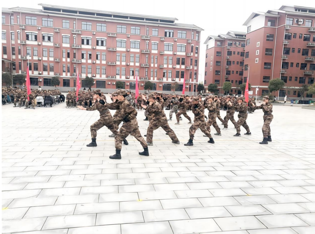
图 1-14 国防班汇操表演