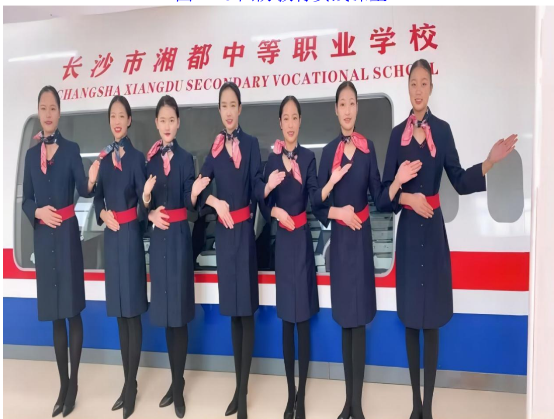
图 1-19 航空服务实训课堂