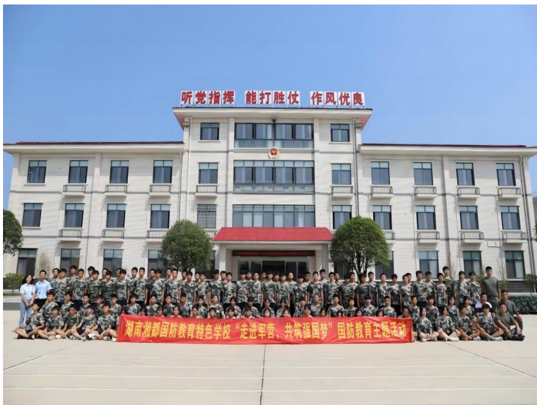
图 1-8 2021 年全国国防教育日——走进军营