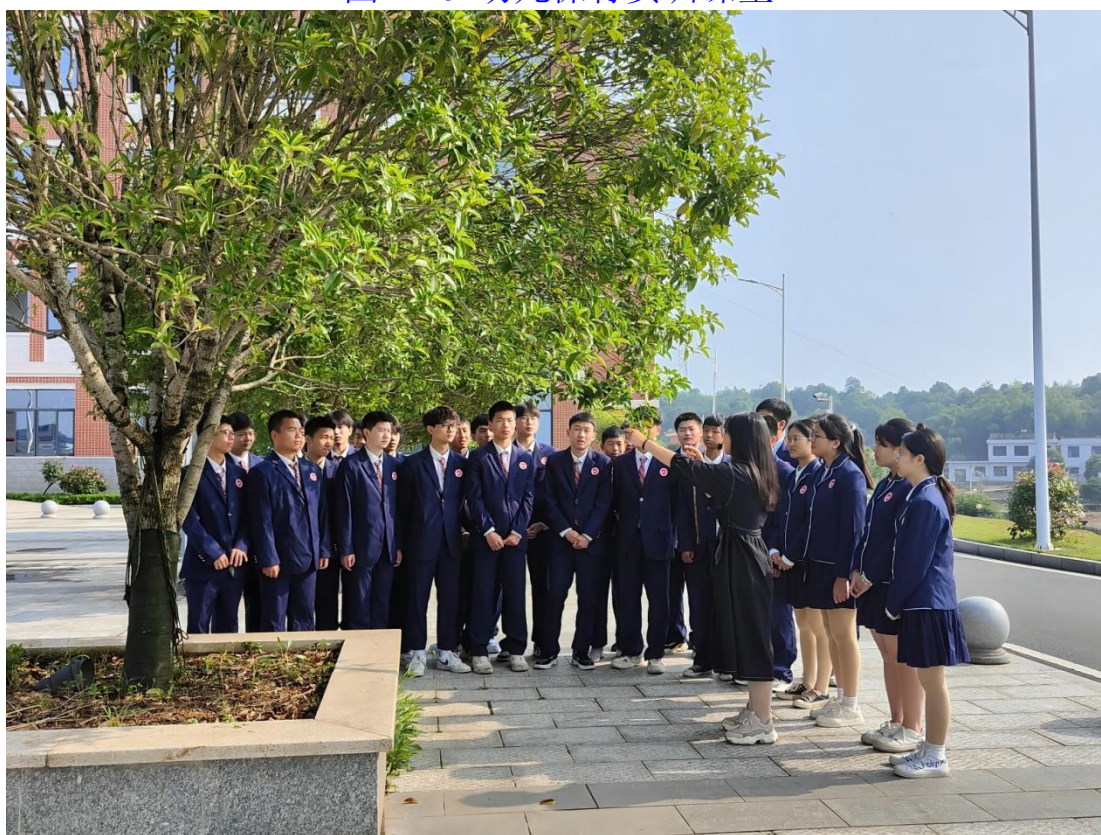
图 1-17 园林技术实践课堂