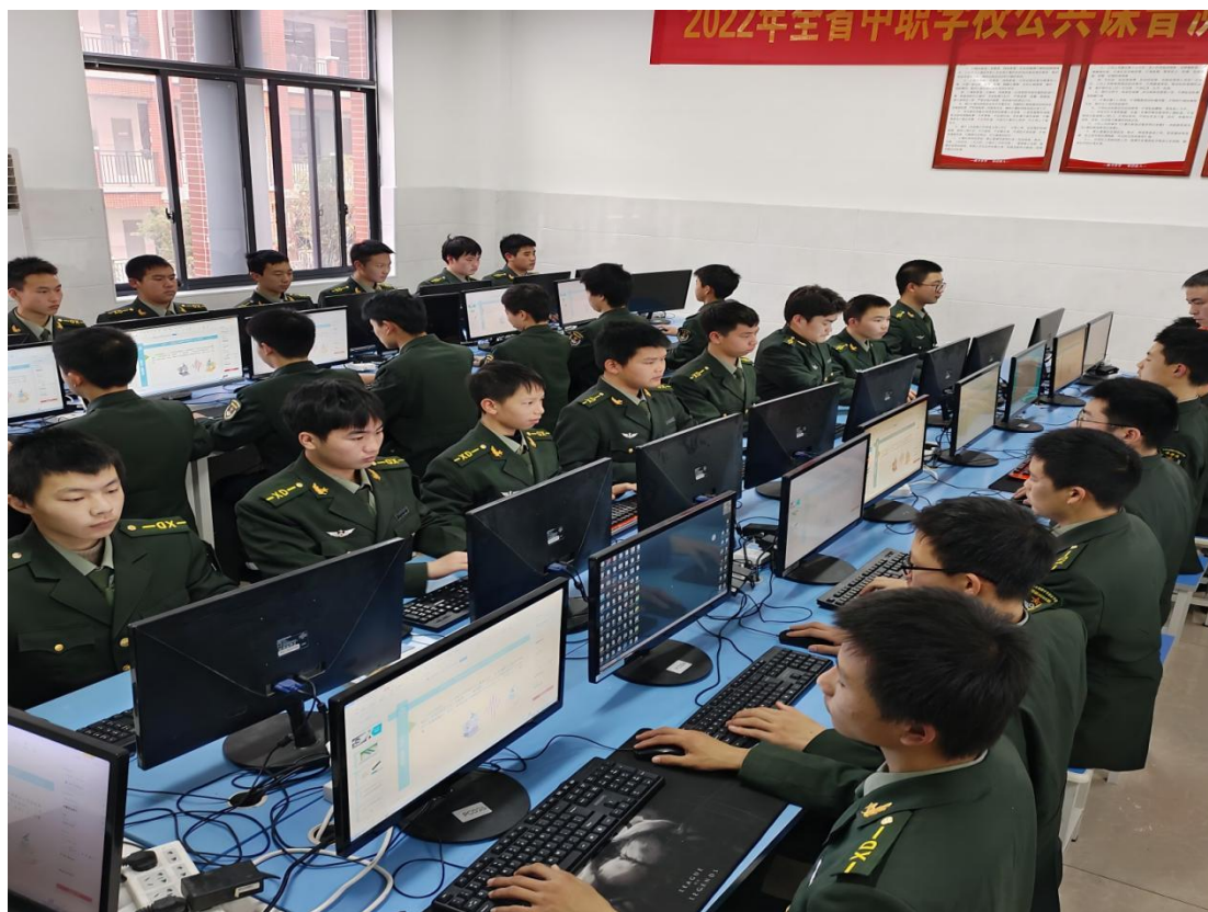
图 1-20 计算机应用专业实训课堂