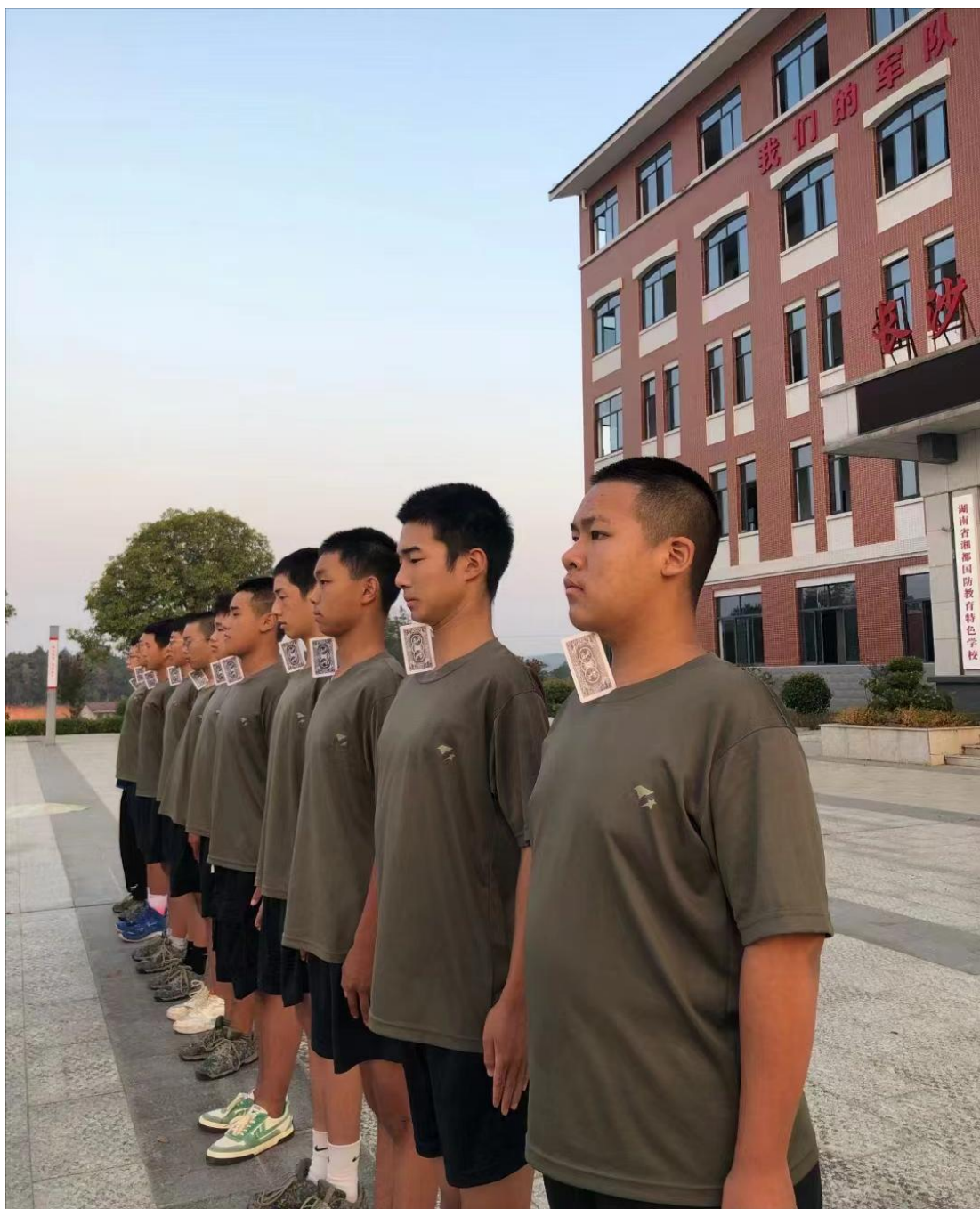
图 1-10 国防训练