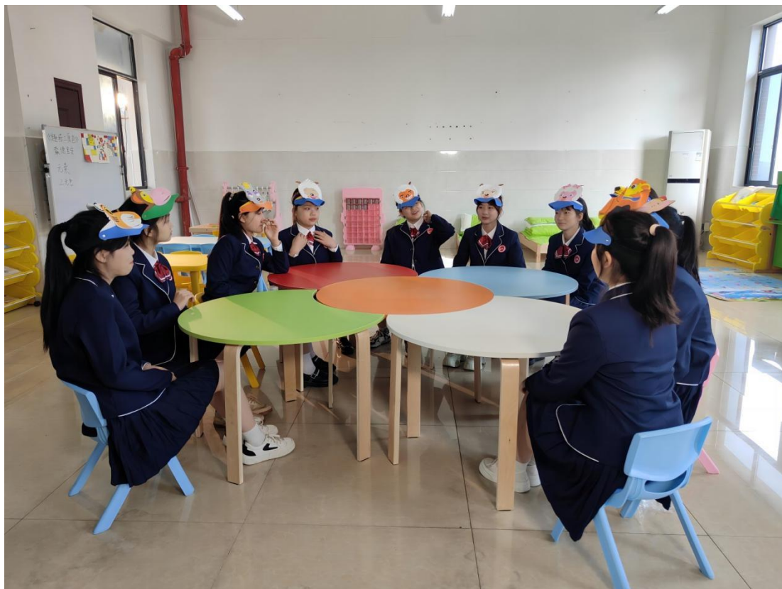
图 1-16 幼儿保育实训课堂