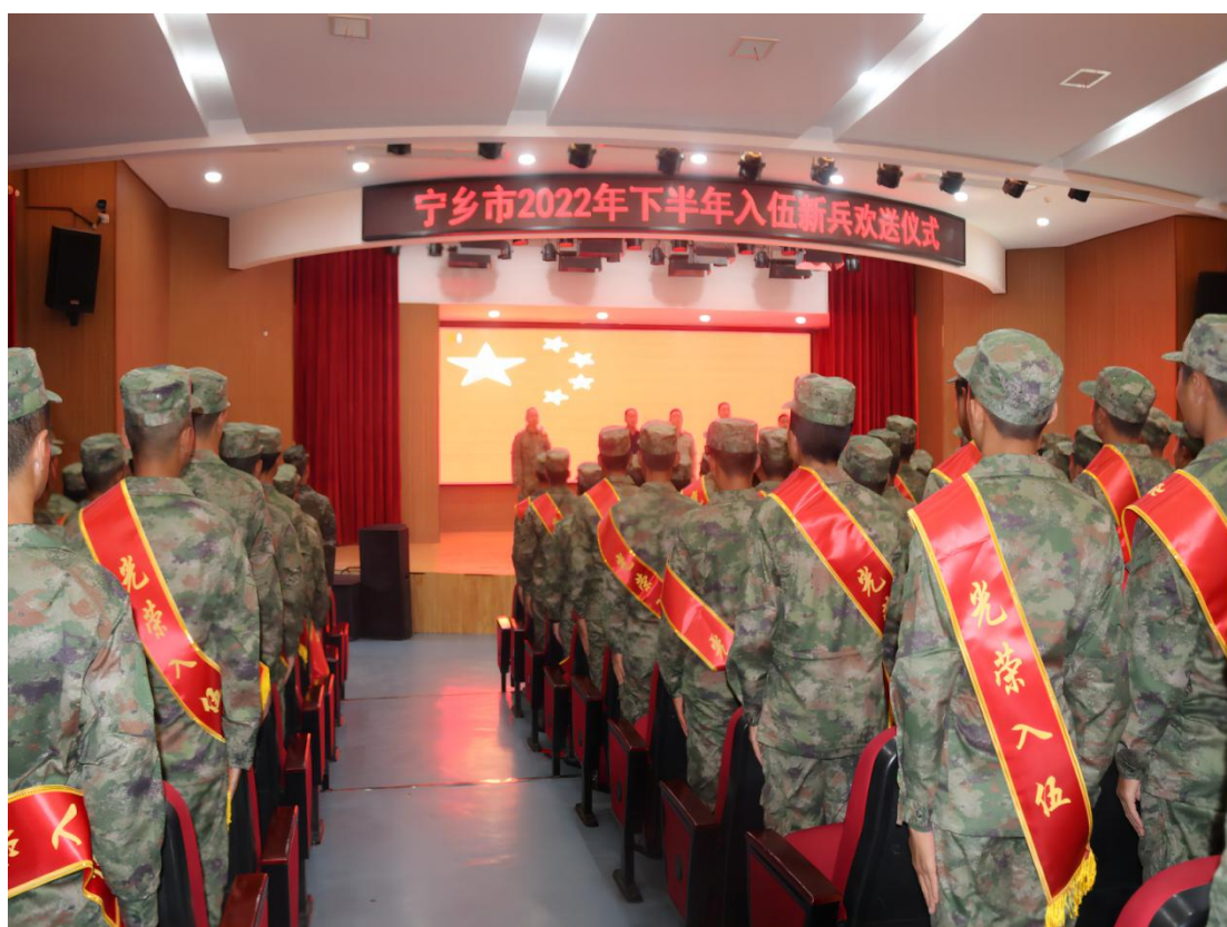
图 1-27 2022 年宁乡市新兵役前教育训练新兵入伍欢送仪式