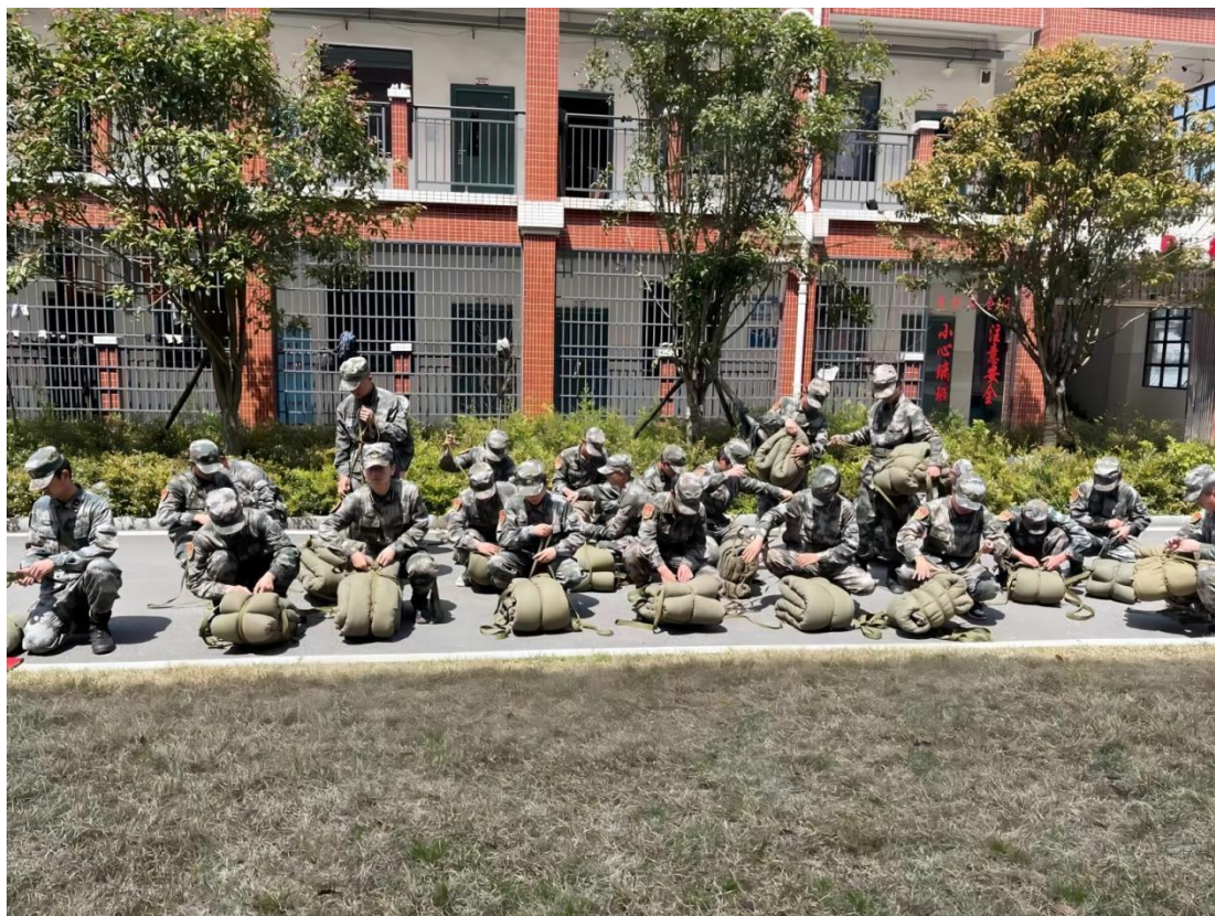
图 1-18 国防教育实践课堂