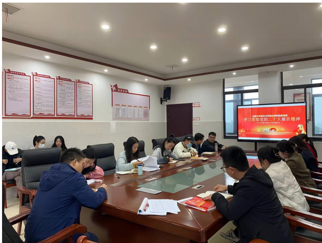
图 1-5 学校行政管理班子学习贯彻党的二十大精神