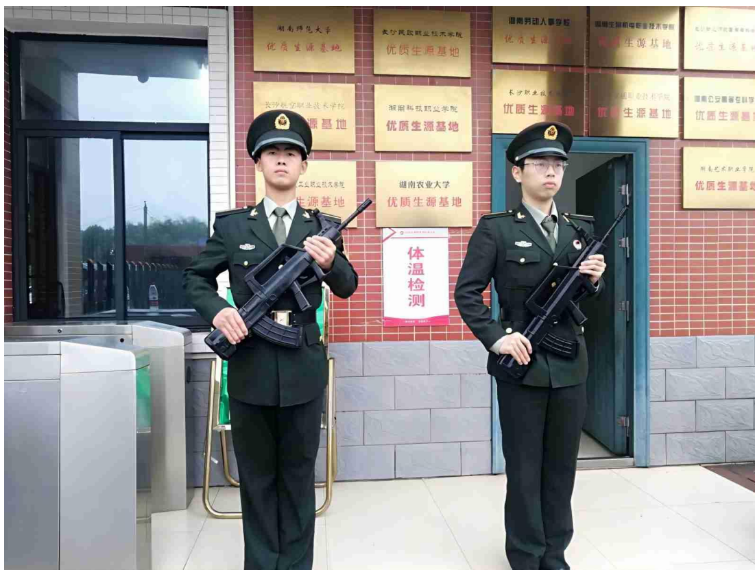
图 1-11 英雄连值勤