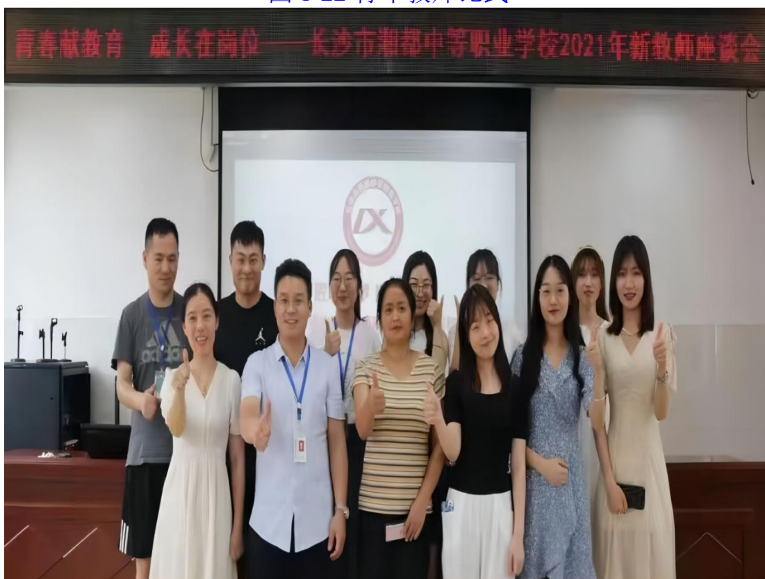
图 1-23 新教师座谈会