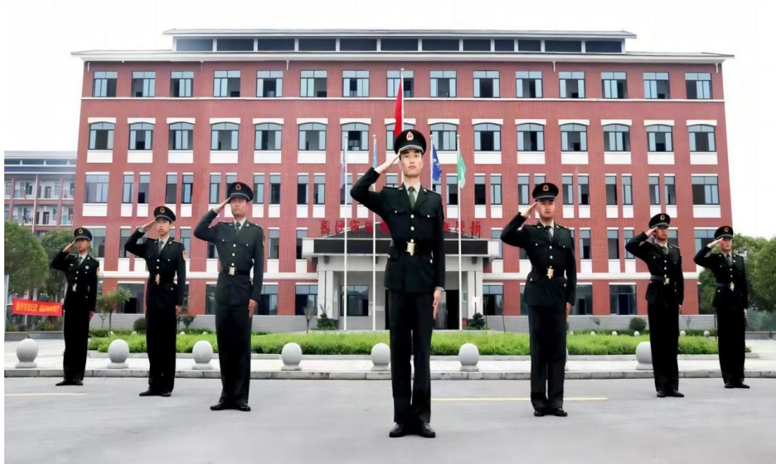
图 1-24 专业教官团队