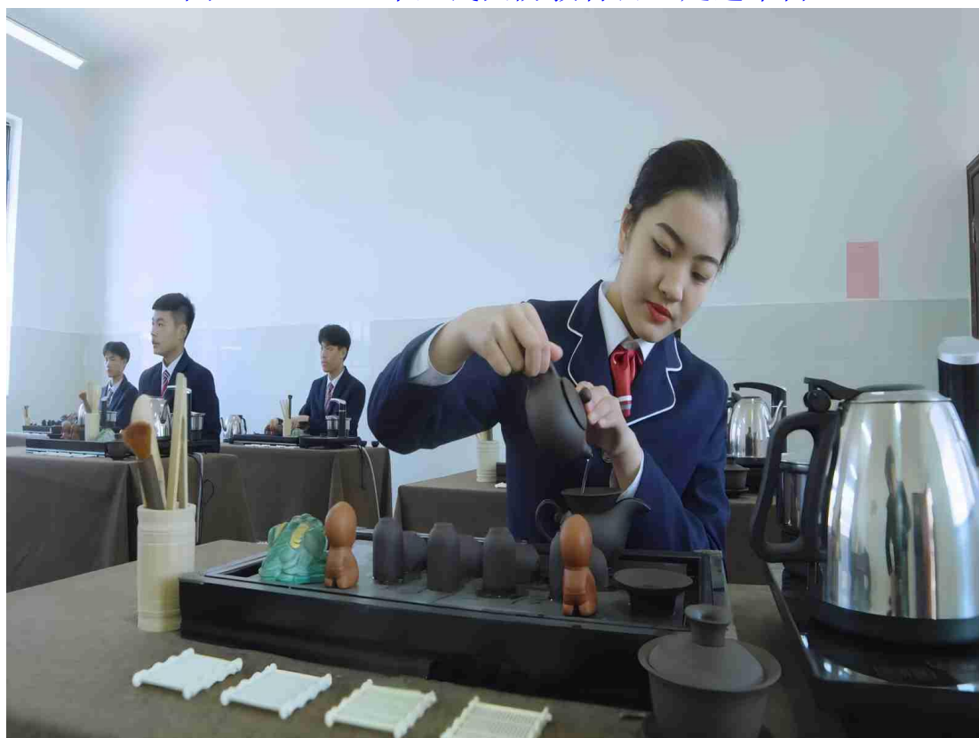
图 1-9 茶艺社团