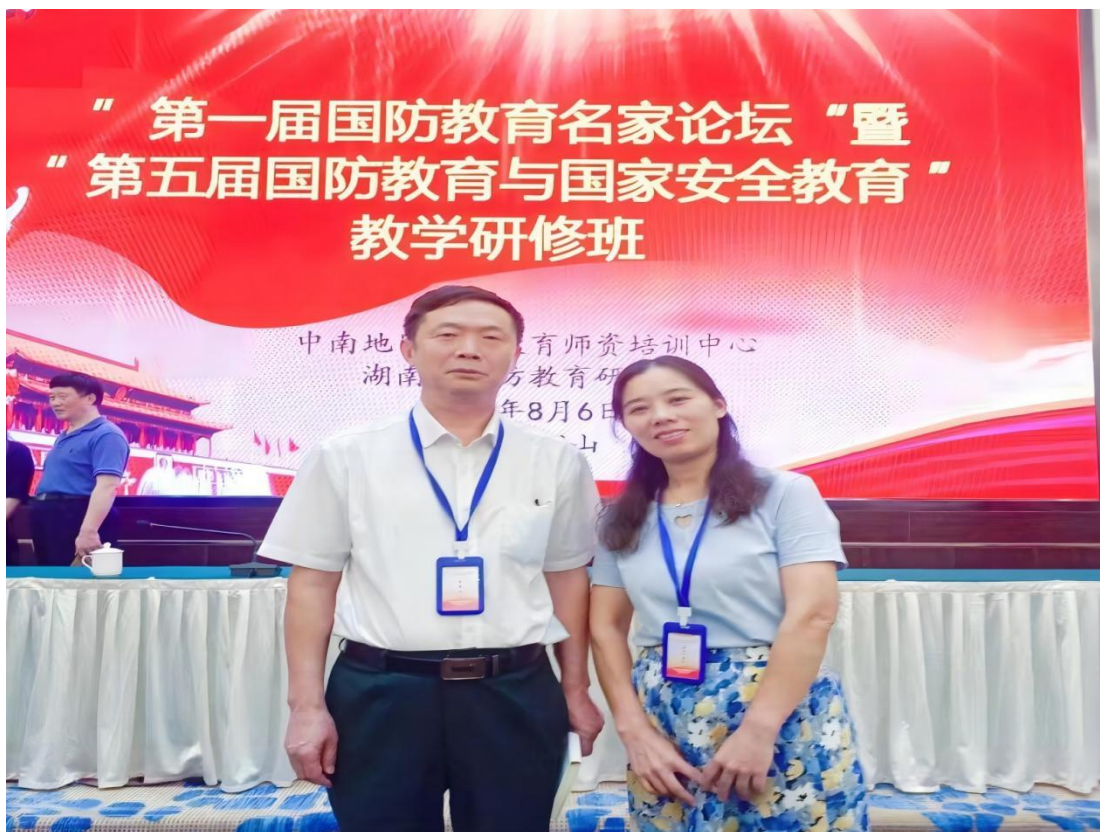
图 1-28 国防办负责人参加国防教育名家论坛