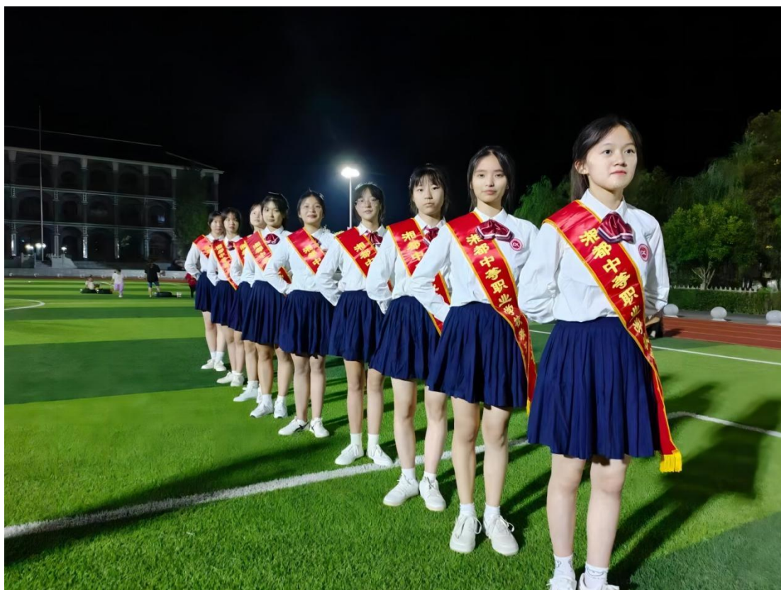
图 1-12 学校礼仪队