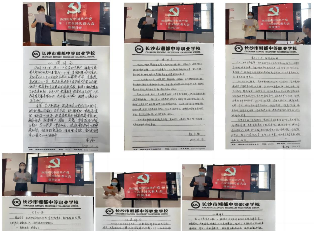
图 1-4 党员分享学习二十大报告心得体会