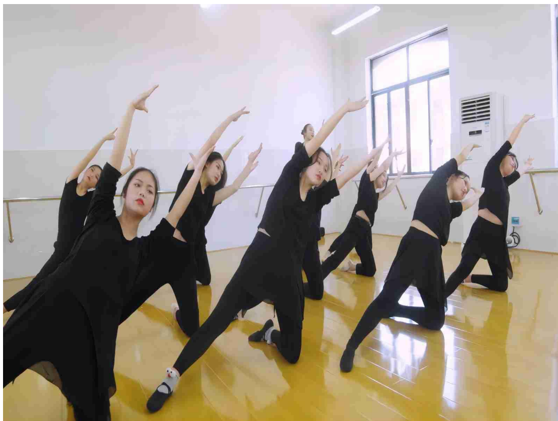
图 1-15 形体课堂

起，根据企业人才需求设置课程与教学计划，专业教师可针对性地开展理论教学和技能培训。学校邀请企业领导、技术人员来学校考察调研，共同探讨学校专业设置，人才培养方式，做到企业把脉，学校改革，促使专业与企业的“无缝对接”。学校并积极参加了湖南省民办教育协会职教教育分会，积极参加宁乡市职教集团组织的相关活动，促进了相关专业的建设和发展。