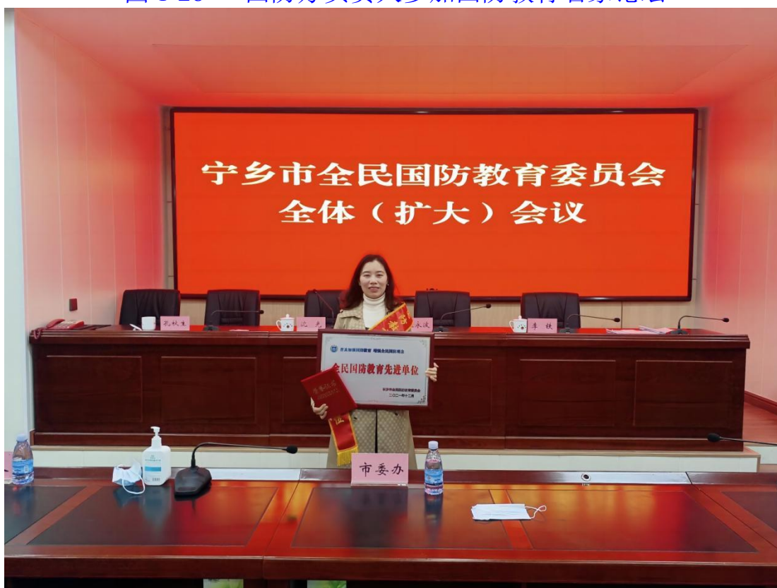
图 1-29 获得长沙市全民国防教育委员会国防教育先进个人